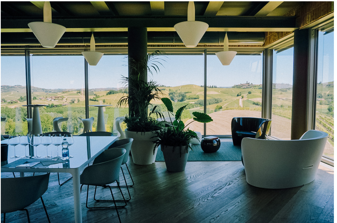
Mauro Molino Tasting room